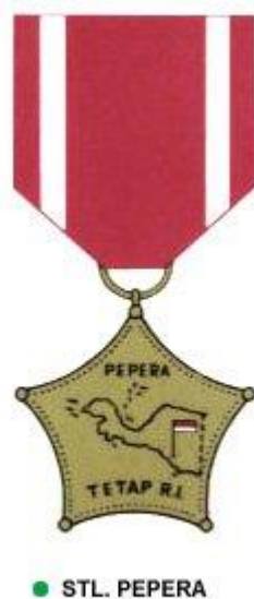
Gambar.9.1. Lencana PEPERA yang diberikan kepada peserta anggota DMP.

Setelah berakhirnya proses Jajak Pendapat ( Self Determination ) tersebut, para anggota DMP tersebut diberi Radio, Gergaji, dan Sekap/Ketam serta dijanjikan akan diberi uang. Kemudian pada tahun 1976 mereka (Anggota DMP) diberi piagam penghargaan dengan uang tunai Rp. 200.000,- lalu tahun 1992 pada saat PEMILU bekas anggota DMP diberikan uang Rp. 150.000,-. Uang berjumlah Rp. 14 milyar yang dikirim dari Jakarta untuk bekas anggota DMP sebagian besar dikorupsi oleh para pejabat tinggi yang ditugaskan dari Jakarta.