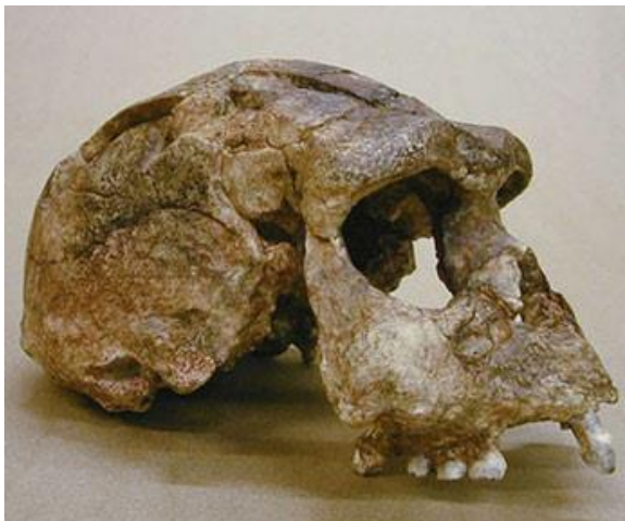
Gambar. 3.2. Fosil Tengkorak Manusia Jawa ( Pithecanthropus Erectus ) yang ditemukan di Solo

Peninggalan arkeolog yang ditemukan di tepi danau sentani – Jayapura berupa Kapak Batu yang berbentuk lonjong merupakan bukti sejarah bahwa orang Papua hanya berada pada zaman Batu Muda ( Neolitikum ).