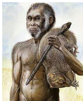
Gambar. 3.1. Manusia Purba

Sementara itu, Zaman Kwartier ditandai dengan munculnya manusia sehingga merupakan zaman terpenting. Zaman ini kemudian dibagi lagi menjadi dua zaman, yaitu zaman Pleitosen dan Holosin. Zaman Pleitosen (Dilluvium) berlangsung kira-kira 600.000 tahun yang ditandai dengan adanya manusia purba.